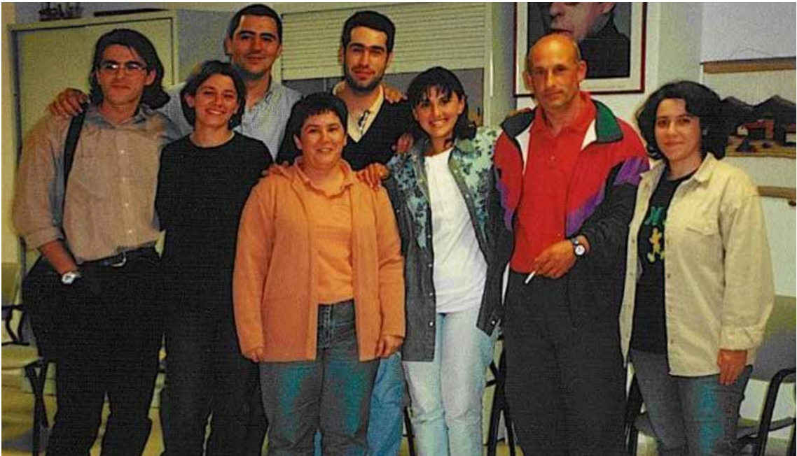
Composición da primeira Xunta Directiva de Alento.