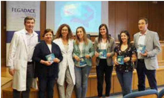
Presentación no CHUS da guía 'Cousas que debes saber sobre o dano cerebral adquirido cando o teu familiar está no hospital'.