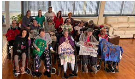
Un grupo de persoas usuarias do servizo residencial de Alento.