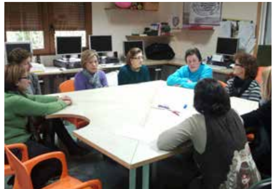
Grupo de apoio mutuo de familias en Sarela.