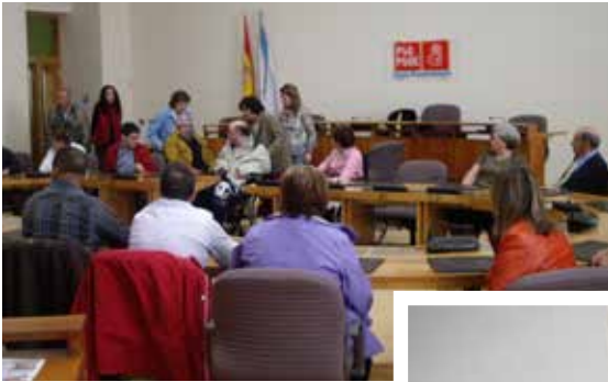
Visita de ADACECO ao Parlamento de Galicia.