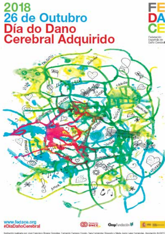
Cartel do Día do Dano Cerebral 2018, cun debuxo elaborado por persoas usuarias de Alento.