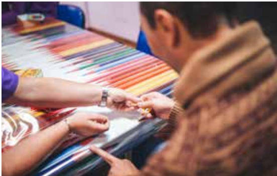
Fotografía tomada en ADACE Lugo dentro da colección 'Punto e seguido'.