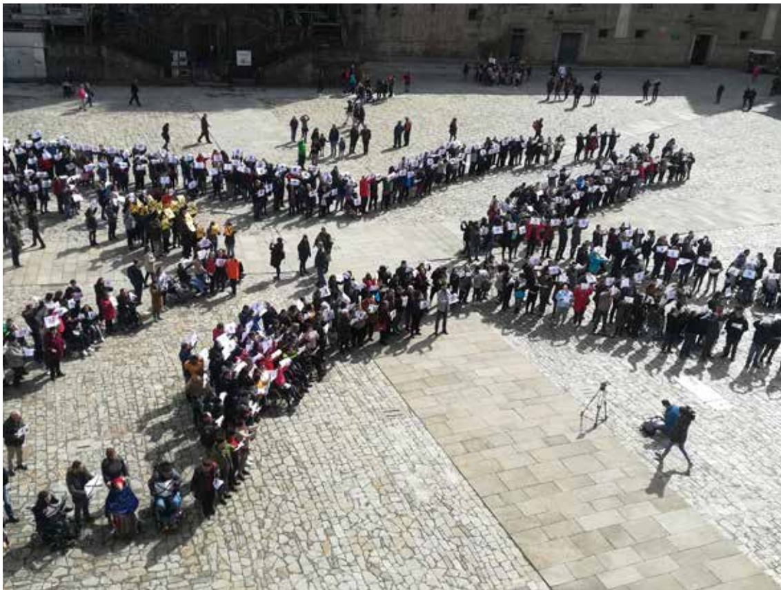
X Solidaria humana en Santiago de Compostela.