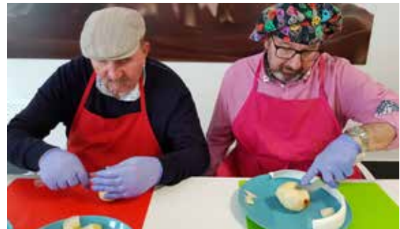
Dous usuarios de Sarela nun obradoiro de cociña na entidade compostelá.