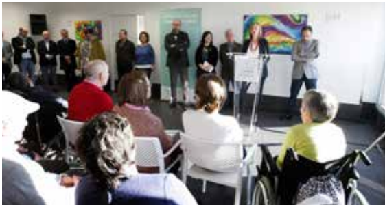
Acto de inauguración institucional do centro de Sarela o 19 de decembro de 2016.