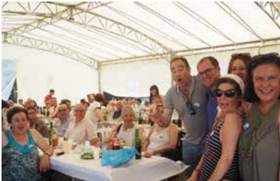
Celebración do décimo aniversario de FEGADACE.