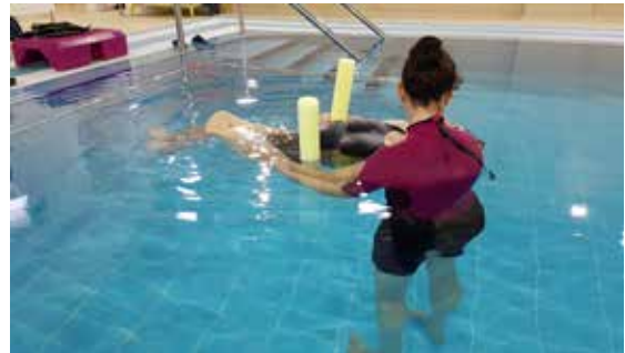
Terapia acuática nas instalacións de Sarela..