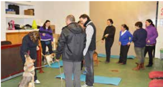
Obradoiro de implicación solidaria na adopción de cans da protectora de animais de Lugo para persoas usuarias de ADACE Lugo.