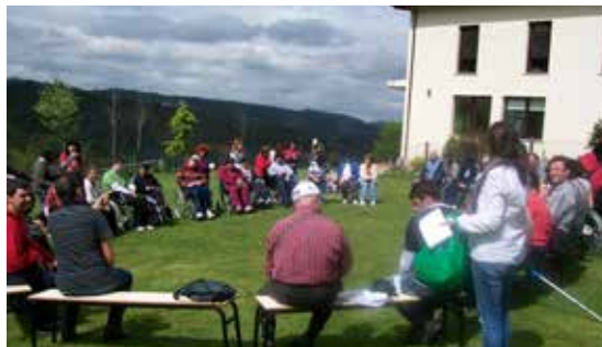
Respiro familiar das asociacións de dano cerebral en Silleda.