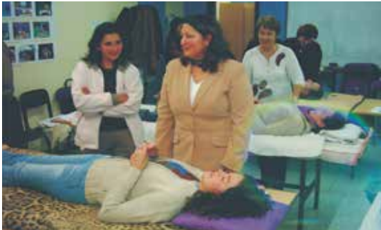
Primeiros pasos da escola de familias de Alento, nas instalacións da rúa García Barbón.