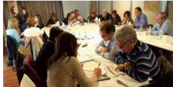
III Encontro de Xuntas Directivas de FEGADACE. Alento, Vigo (25/04/2015).