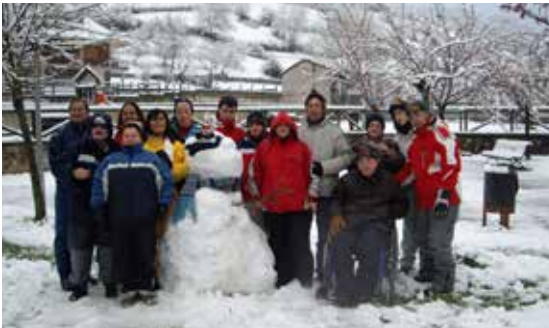
Primeira visita á neve para persoas usuarias de ADACECO.