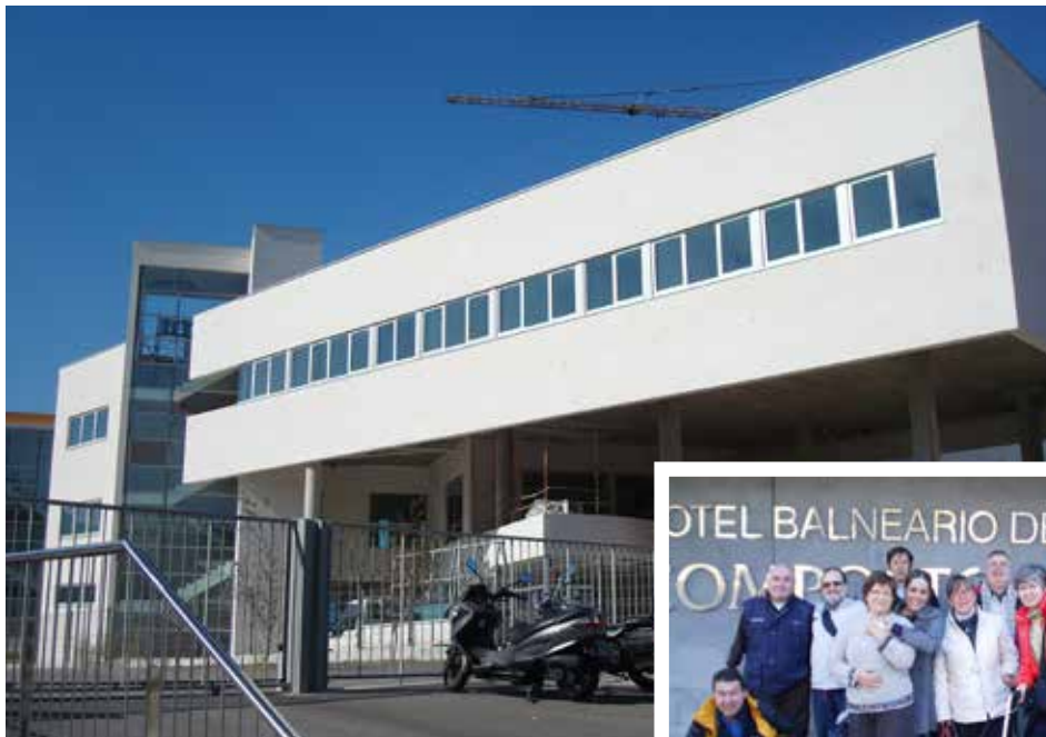
Finalización das obras de construción do centro de Alento en Navia.