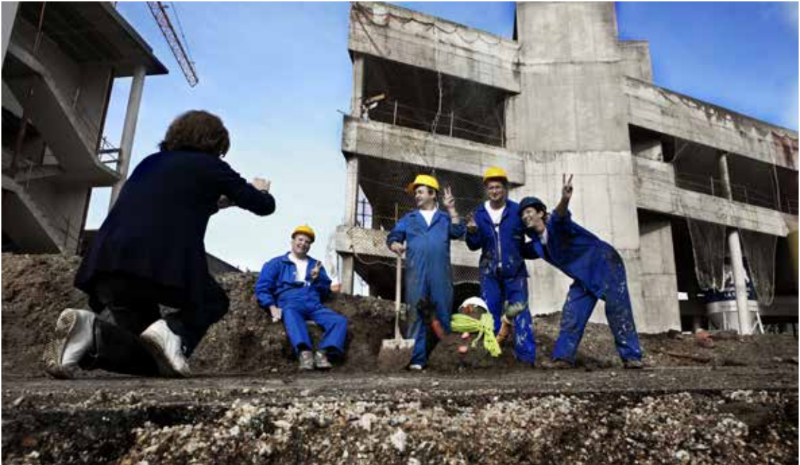
Inicio da construción do centro de Alento en Navia.