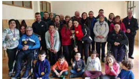
Primeiro torneo de boccia para persoas con dano cerebral e familiares de ADACE Lugo.