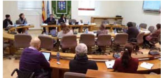
Comparecencia do secretario de FEGADACE, na Comisión non Permanente de Discapacidade do Parlamento de Galicia.