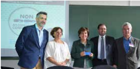
IV Foro de Familias (30/05/2015).