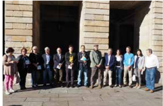
Acto de lectura do manifesto do Día do Dano Cerebral coa corporación municipal de Santiago de Compostela, Sarela e FEGADACE.

■ O tecido asociativo da discapacidade na Coruña lanza a campaña 'Baixo o mesmo paraugas' para conmemorar o Día Internacional da Discapacidade. As asociacións e a Federación de dano cerebral súmanse á iniciativa a medida que se vai estendendo a outras cidades e vilas de Galicia.