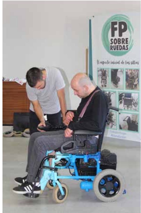
Demostración da adaptación dunha cadeira de rodas dentro do proxecto 'FP sobre rodas'.