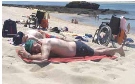
Un grupo de persoas usuarias de Alento, de vacacións na Guarda.