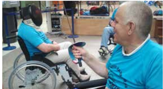
Dous usuarios de Sarela practican esgrima paralímpica.