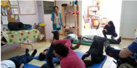
Sesión de pilates en ADACE Lugo.