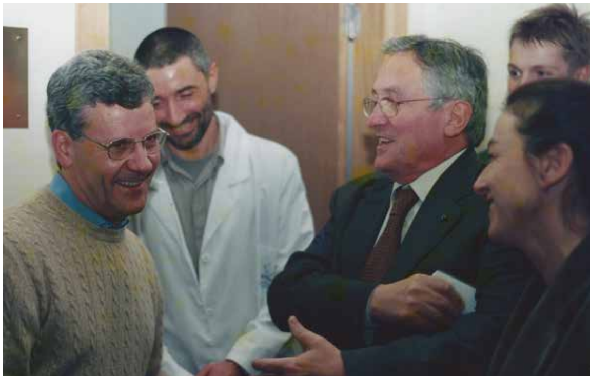
Inauguración das instalacións de Sarela na rúa do Ceo (Santiago) o 1 de setembro de 2003.