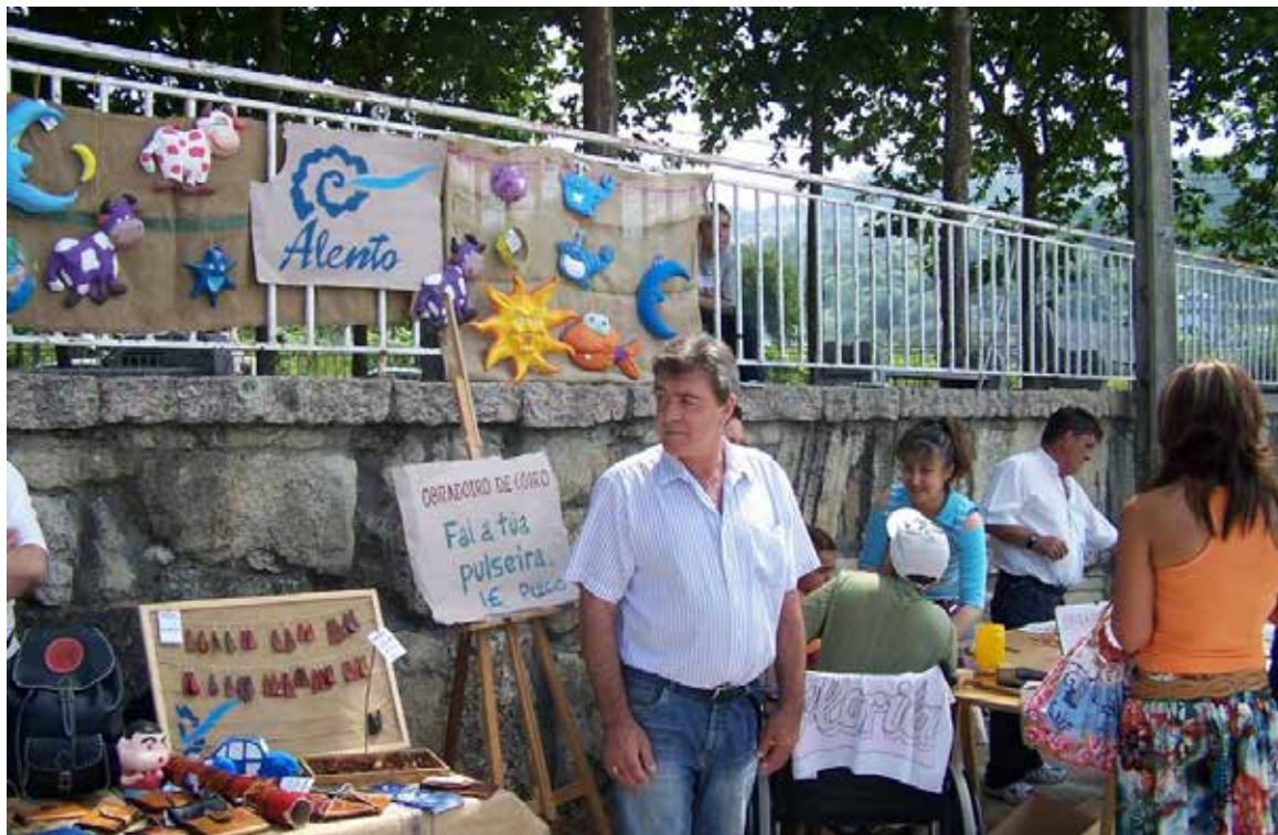
Alento participando no Mercado Solidario en Goián.