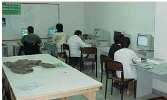
Un obradoiro de informática contouse entre as primeiras actividades organizadas por Alento.