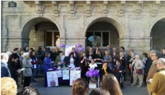
Lectura do manifesto do Día do Dano Cerebral de 2017 organizada por ADACE Lugo.