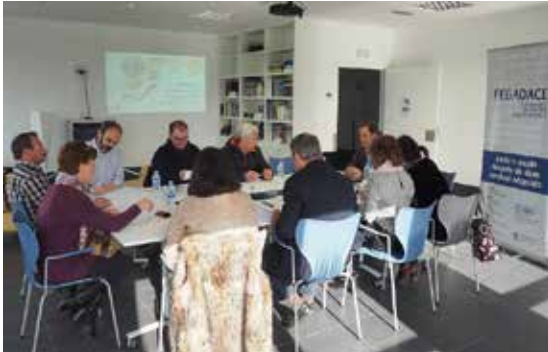
Asemblea xeral ordinaria de FEGADACE.