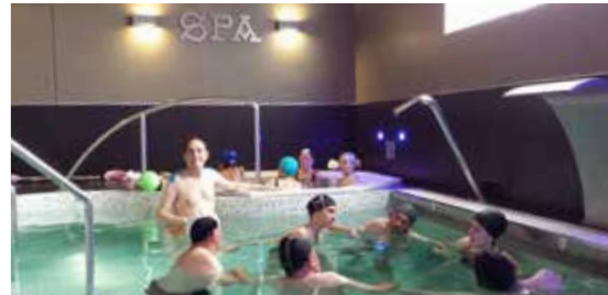
Un grupo de persoas usuarias de Renacer na actividade de terapia acuática.