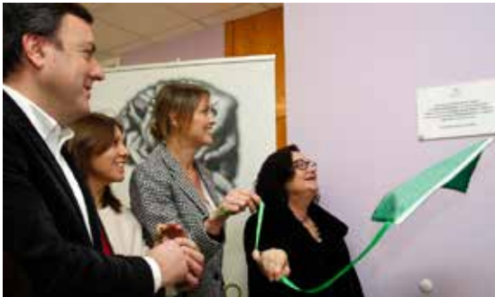
Inauguración do segundo centro de ADACECO na Corveira (Culleredo).