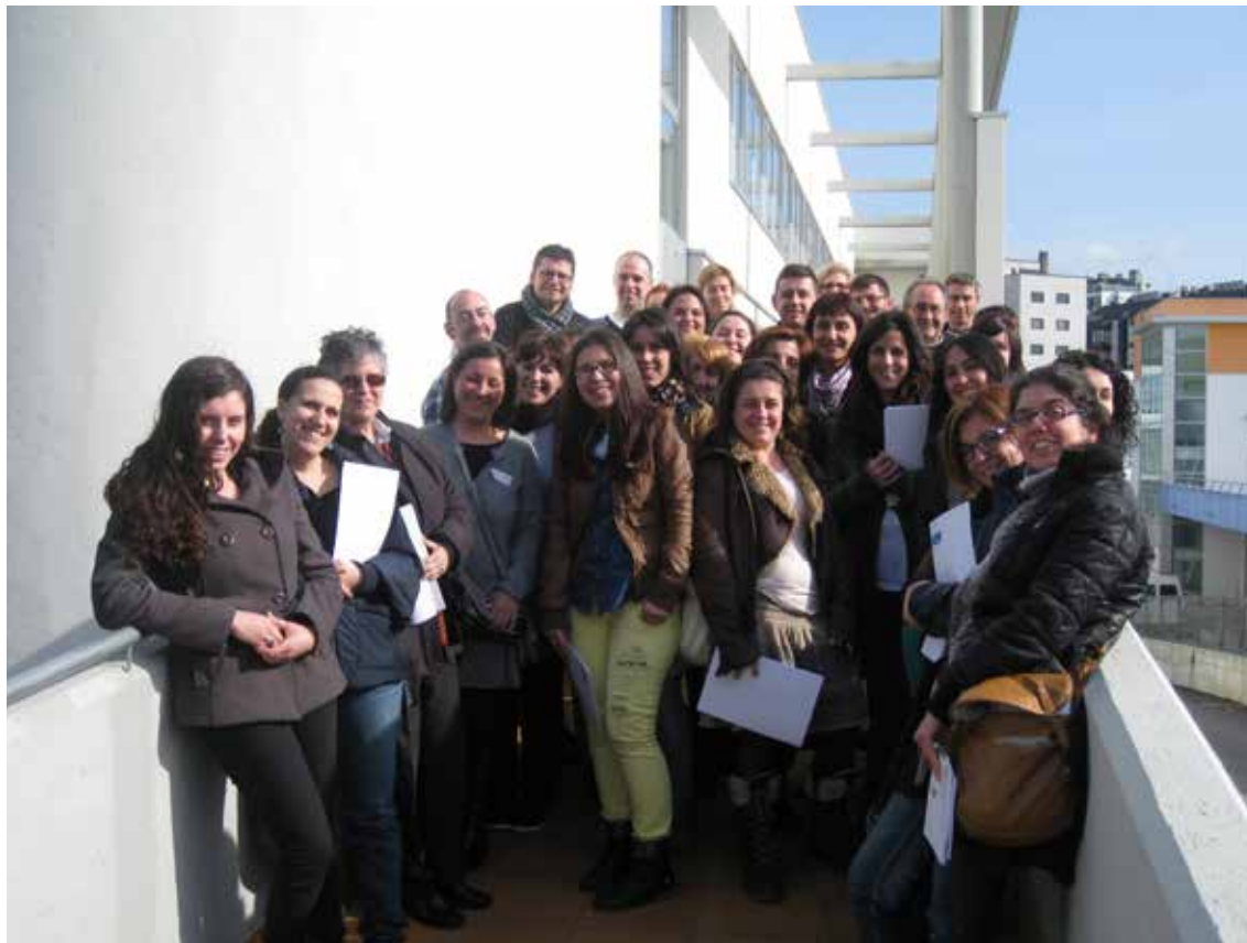
1 Encontro de Voluntariado de FEGADACE. Alento, Vigo (06/04/2013).