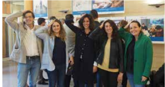
As directoras e director das asociacións de FEGADACE facendo o aceno do Día do Dano Cerebral.