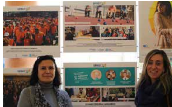
Inauguración da mostra CapacitArte, organizada polo CERMI Galicia na consellería de Política Social con motivo do Día da Discapacidade.