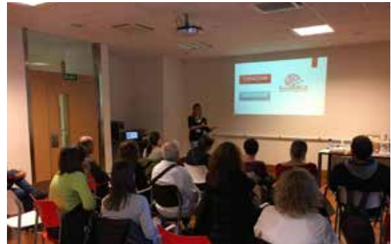
Inauguración da EscolaDCA de Alento.