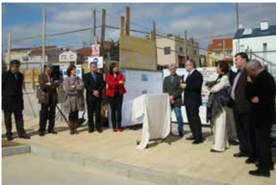
Acto institucional de colocación da primeira pedra do novo centro de Sarela.