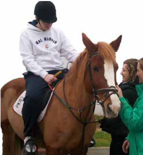
Un usuario de Renacer participa na actividade de hipoterapia.