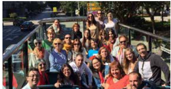
"IX Encontro de Voluntariado y Daño Cerebral" da FEDACE, organizado en Vigo.