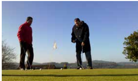
Usuarios de Sarela asisten a clases de golf.