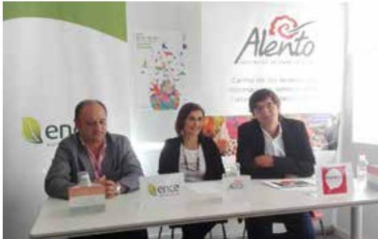
Inauguración en 2017 do punto informativo de Alento en Pontevedra: PonteDCA.