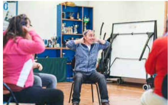
Fotografía tomada no obradoiro de teatro de Renacer dentro da colección 'Punto e seguido'.