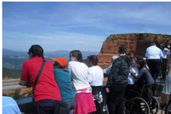
Respiro familiar de Renacer nas Médulas.