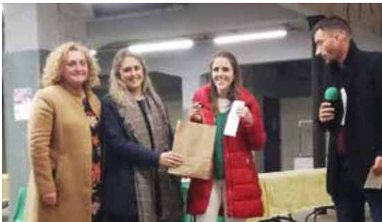
Premio a ADACE Lugo da Rede Lucense de Voluntariado.