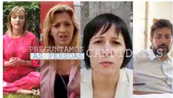
Vídeo no que FEGADACE preguntou ás catro principais forzas políticas polas súas propostas para o colectivo do dano cerebral perante as eleccións autonómicas de 2020.