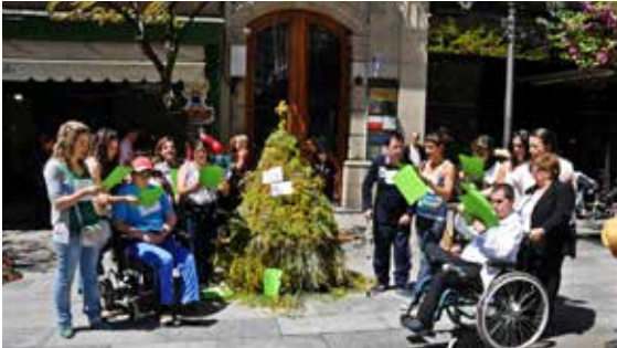
Renacer participa na Festa dos Maios de Ourense.