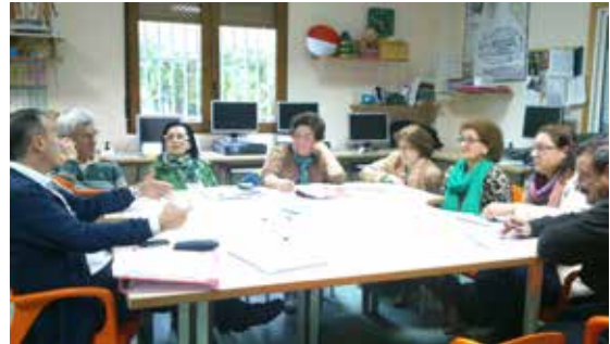
Reunión da Xunta Directiva de Sarela.