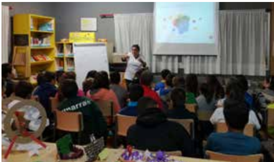
Obradoiro de 'Prevenção viaria e DCA' organizado para escolares por ADACE Lugo.