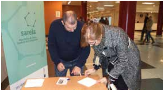
Mesa informativa de Sarela no marco da campaña de prevención e sensibilización sobre o ictus no CHUS.