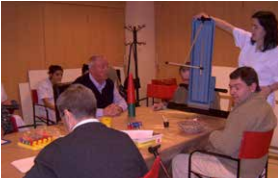
Primeiras sesións grupais de Terapia Ocupacional en ADACECO.