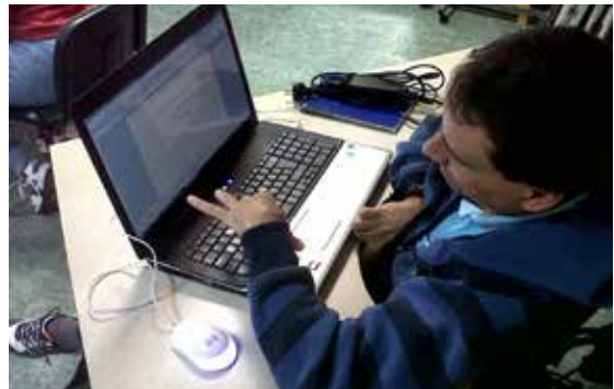
Un usuario de Sarela nun obradoiro de informática en 2012.