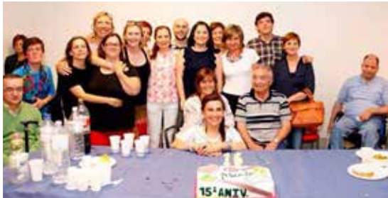
Commemoración do 15º Aniversario de Alento.