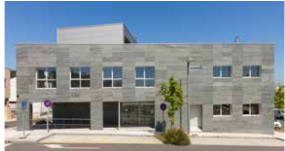
Exterior do centro de Sarela coa construción totalmente finalizada en 2015.