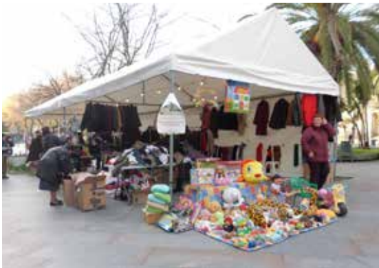
Mercado Solidario de Renacer.