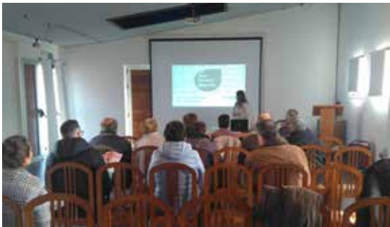
Charla de sensibilización sobre o dano cerebral en Ourense.