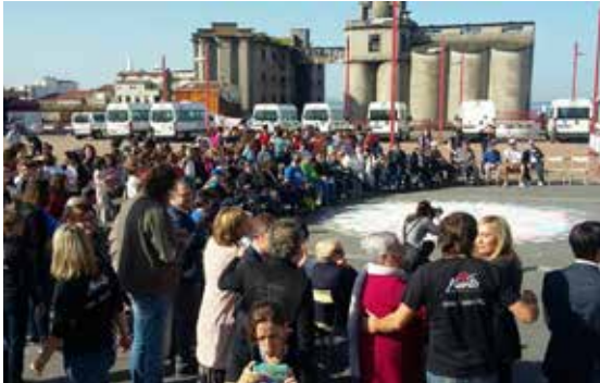
Terceira edición de 'Alento na rúa', en Vigo.