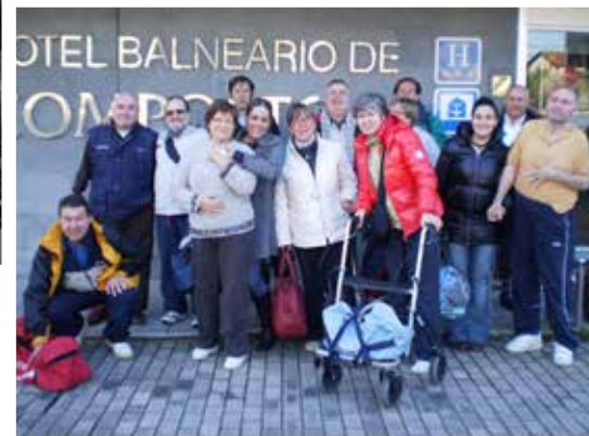
Visita ao balneario para conmemorar o 10º aniversario de ADACECO.