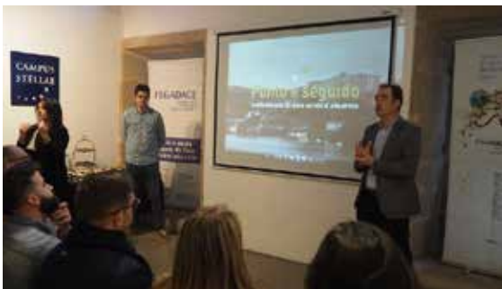
Inauguración da mostra 'Punto e seguido'. A vida con 'dano cerebral adquirido' o 20 de marzo de 2018 en Santiago.