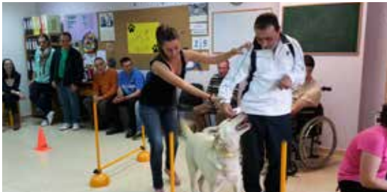
Terapia con animais en ADACE Lugo.