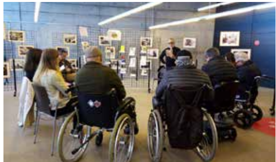
Lectura de Iridium e exposición de libros e fotografías sobre o dano cerebral polo 26 de outubro de 2019.