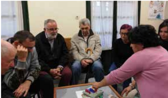
Unha sesión da EscolaDCA de ADACE Lugo.