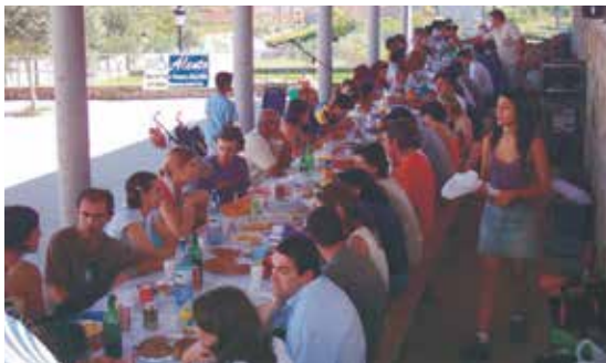
Xuntanza de familias de Alento en San Campio de Figueiró.