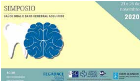
Simposio sobre Saúde Oral e Dano Cerebral, organizado online en novembro de 2020.