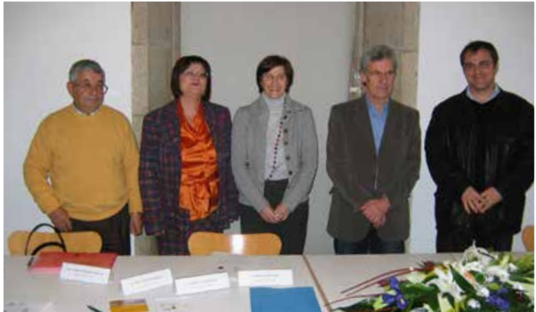
Acto Prefundacional da Federación Galega de Dano Cerebral Adquirido (12/01/2007), coa primeira xunta directiva.