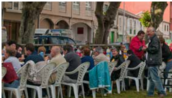
Sardiñada de celebración do 10º aniversario de ADACECO.