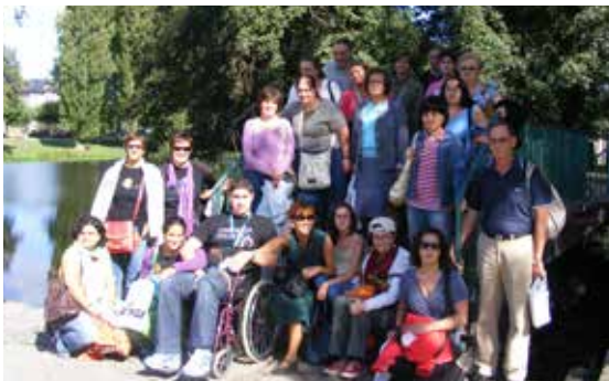
Excursión a Allariz das persoas usuarias de ADACE Lugo.