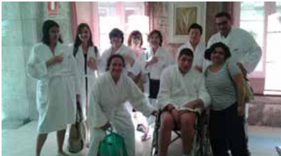
Saída de balneario nun respiro familiar de ADACE Lugo (2016).