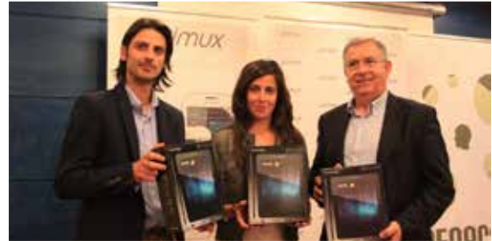
Renacer asinou un convenio con Primux, para facilitar a adquisición de produtos tecnolóxicos ás súas persoas usuarias.