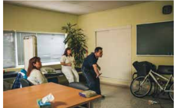
Fotografía tomada en ADACECO dentro da colección 'Punto e seguido'.