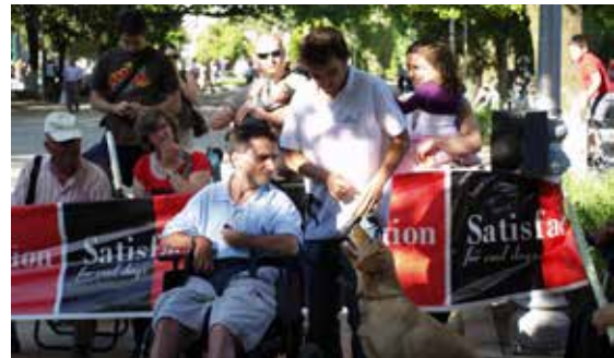
Persoas usuarias de Sarela realizan unha exhibición da actividade de agilidad con cans.