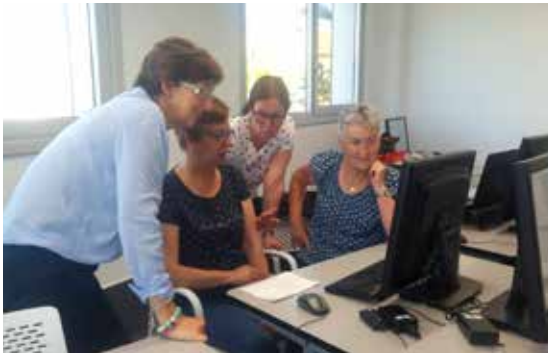
Curso de informática para familias en Sarela.